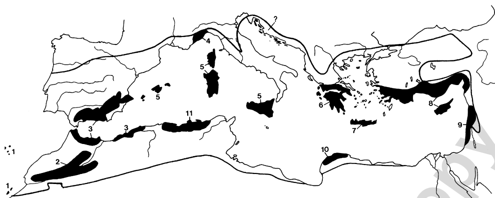
Fig. 2. Délimitation géographique du point chaud « Kabyliens–Numidie–Kroumirie » et positionnement au sein de l'ensemble de points chauds du « Bassin méditerranéen » (source : [18], modifié). 1, Madère et Canaries ; 2, Haut et Moyen Atlas ; 3, complexe bético-rifain ; 4, Alpes maritimes et ligures ; 5, îles tyrrhéniennes ; 6, Sud- et Centre-Grèce ; 7, Crète ; 8, Sud-Anatolie et Chypre ; 9, Syrie–Liban–Israël–Palestine ; 10, Cyrénaïque méditerranéenne ; 11, Kabyliens–Numidie–Kroumirie (présent travail) ; ?, littoral et archipels dalmates (suggéré par Nikolić et al., soumis).

taux sont de nature terrestre marécageuse ou aquatique, et les plaines, tout comme les montagnes, possèdent un panel intéressant de secteurs naturels encore sauvages, qui contrastent avec d'autres, plus ou moins fortement anthropisés par l'agriculture ou l'urbanisation.